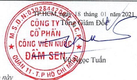
Vũ Ngọc Tuấn

Bản thuyết minh báo cáo tài chính hợp nhất là phần không thể tách rời của báo cáo này